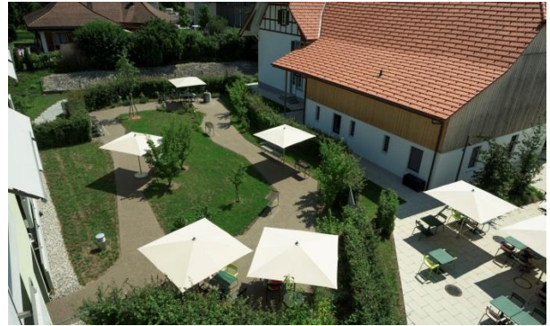
Gartenanlage der Demenzwohngruppe

Vivale Lindenhof bietet auf drei Geschossen in insgesamt 60 Zimmern stationäre Pflege an.