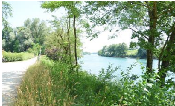
Uferweg entlang der Aare