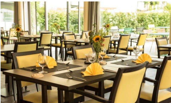
Bistro Korn mit gemütlicher Gartenterrasse