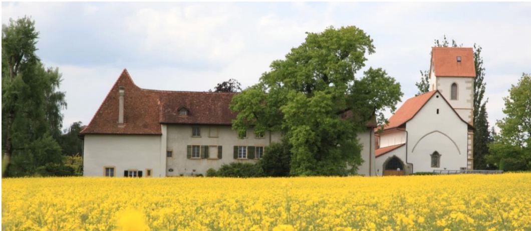
Kloster Gottstatt, Orpund

Orpund ist ein attraktiver Wohn- und Arbeitsort im bernischen Seeland. Die Gemeinde mit kleinstädtischer Struktur liegt in der Agglomeration von Biel und zeichnet sich durch eine hohe Wohnqualität aus.