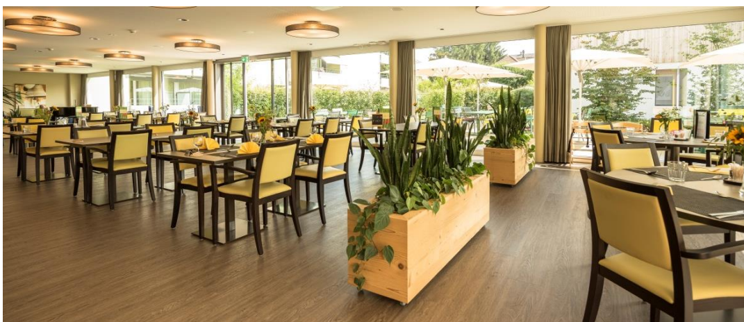
Bistro Korn mit Sonnenterrasse

Das öffentliche Bistro Korn bietet sich als Treffpunkt für Bewohnende, Pensionärinnen und Pensionäre sowie für externe Gäste an. Hier werden unsere Gäste täglich mit abwechslungsreichen Mittagsmenüs und frischen Gebäcken aus unserer Küche verwöhnt.