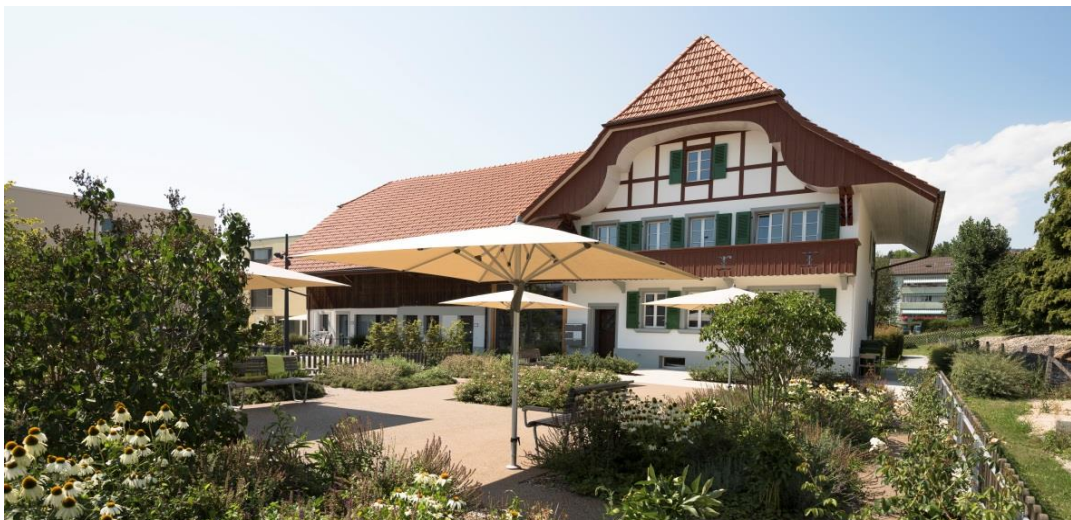
Altersgerecht saniertes Bauernhaus

Das öffentliche Bistro Korn bietet sich als Treffpunkt für Bewohnende, Pensionärinnen und Pensionäre sowie für externe Gäste an. Hier werden unsere Gäste täglich mit abwechslungsreichen Mittagsmenüs und frischen Gebäcken aus unserer Küche verwöhnt.