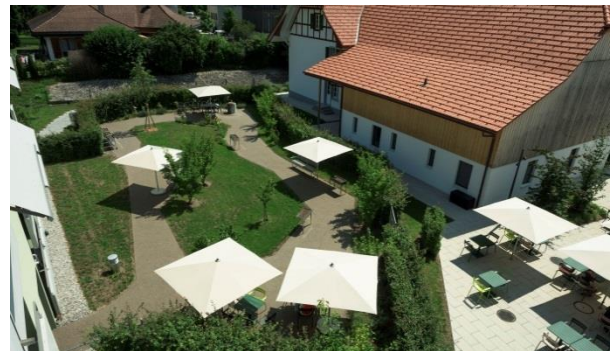
Gartenanlage der Demenzwohngruppe

Das Hauptgebäude bietet Raum für Begegnungen und lädt zum gemütlichen Verweilen ein. Der Eingangsbereich mit Rezeption ist eine wichtige Informations- und Vermittlungsstelle für Bewohnende, Pensionärinnen und Pensionäre sowie für externe Gäste. Hier erfahren Sie alles über die regionalen und hauseigenen Veranstaltungen. Bei Fragen und persönlichen Anliegen helfen Ihnen unsere Mitarbeitenden gerne weiter.