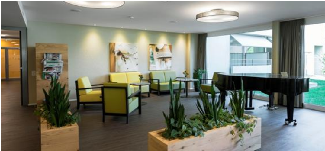
Lounge im Eingangsbereich

Die Wohnhäuser A und C sind unterirdisch mit dem Hauptgebäude verbunden. Die altersgerechten Neubauten verfügen jeweils über einen Personenaufzug und sind hindernisfrei wie auch rollstuhlgängig gebaut. Die Umgebung mit Gartenanlage lädt zum Verweilen ein.