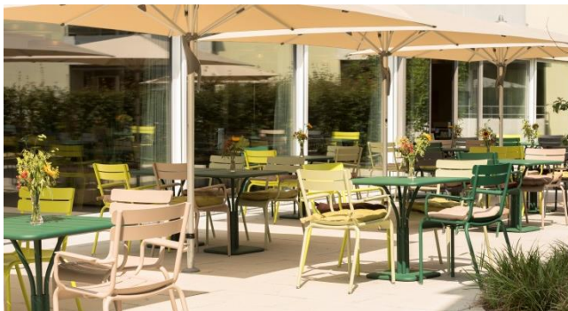
Sonnige Gartenterrasse des Bistros Korn

In unmittelbarer Nähe befindet sich das Hausärzteezentrum von Orpund. Mit dem Ärzteezentrum besteht eine vertragliche Zusammenarbeit. Diverse Einkaufsmöglichkeiten, Banken und weitere Restaurationsbetriebe sind in Gehdistanz erreichbar. Die Haltestelle für den Bus ist ca. 200 Meter entfernt.